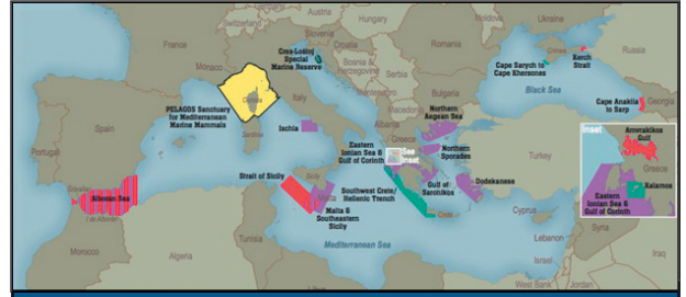
Aires protégées pour mammifères marins d'ACCOBAMS.